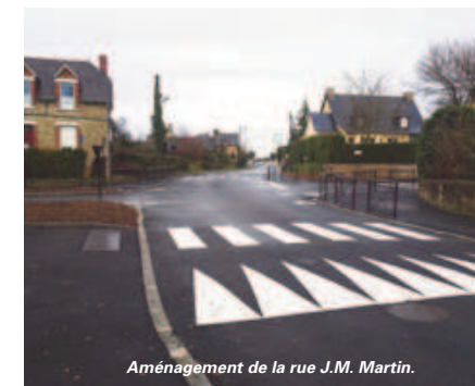
Aménagement de la rue J.M. Martin.

C'est le nom donné par les techniciens aux lieux où se croisent des flux piétons/cycles et des flux de véhicules motorisés. Ces points singuliers ont été répertoriés, catégorisés et étudiés dans le cadre du schéma vélo. Ils sont progressivement aménagés dans l'objectif de faciliter la cohabitation des différents usagers et offrir une meilleure continuité aux axes identifiés pour la pratique du vélo. Dans les prochains mois de nouvelles traversées vont être mises en chantier, notamment : avenue Abbé Barbedet (au niveau de l'école et au niveau du centre commercial) et rue du Calvaire devant l'Ehpad.